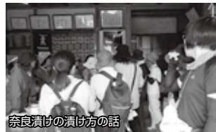
奈良漬の漬け方の話

お聞きしました。「知らない道を歩けて良かった」「甘い酒おいしかった」など楽しいウォーキングになりました。