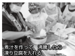
煮汁を作って、沸騰したら凍り豆腐を入れる

夏休みに入った親子も参加し、「畑のそぼろソース」「凍り豆腐のナムル」等を作りました。