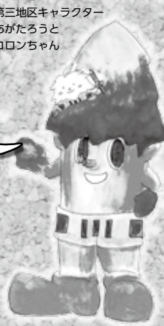
第三地区キャラクター あがたろうと コロンちゃん

のきらめきコートに取り付けられます。地域の方も一読され子どもにお伝えして下さい。これからはまちづくり協議会としても住民が安全に利用できる環境づくりに努力して参ります。地域の皆さんもイオンモール松本に愛着を持ってご利用していただきたいと思えます。