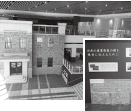
地区の歴史を伝える学びの場 (きらめきコート)

イオンモール株式会社には地域住民、まちづくり協議会と共に、お願いした要望等の実現に努力していただき素晴らしい自然に溶け込んだ魅力あ