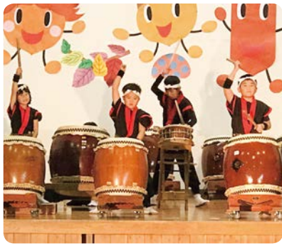
前日祭 ● 中山太鼓連