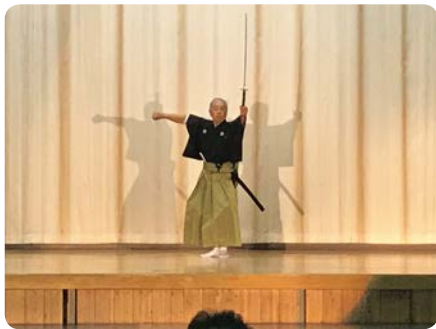
中山詩吟と剣詩舞