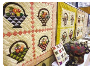
棚峯パッチワーク