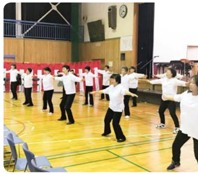
前日祭 ● 健康体操