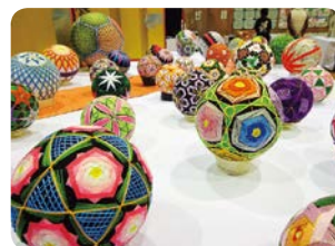
なごみ手まりの会