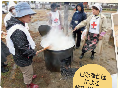
日赤奉仕団による炊き出し訓練

今年で32回目となる鎌田地区文化祭が10月21、22日の2日間、盛大に行われました。