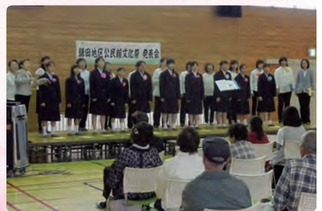
発表会では歌、大正箏、マジック、フラダンス、太極拳など、多彩な発表で盛り上がりました!