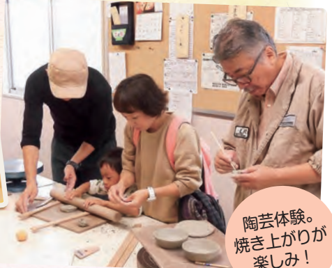
陶芸体験。焼き上がりが楽しみ!