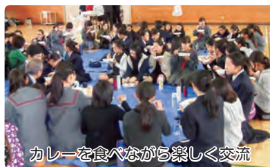
カレーを食べながら楽しく交流