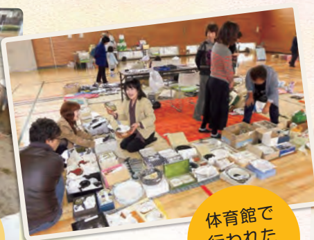
体育館で行われたバザー