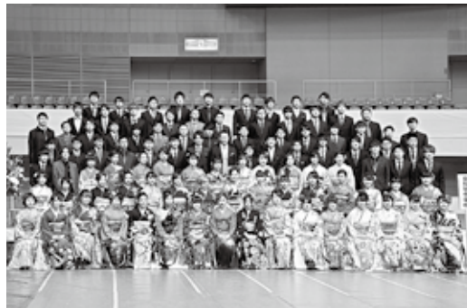
女鳥羽中学校の集合写真

5年前に中学校を卒業した子ども達も今年は20歳。「良い経験を積み、立派な大人になりたい」「ダメなことをダメと言える大人になりたい」など、それぞれに思い描く現在と未来のあり方を熱く語ってくれました。