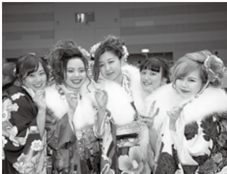
夢に向かってます！