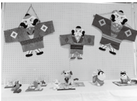
来館者の話題にも

本郷公民館の「ロビー展」。「縫いぬいの会Ⅲ」さんの「奴凧と千支の飾り物」で新年がスタートしました。展示についての問い合わせは本郷公民館にお願いします。