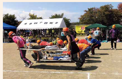
初めての試みで防災リレーを行いました。 2丁目町会が8連覇を成し遂げました。