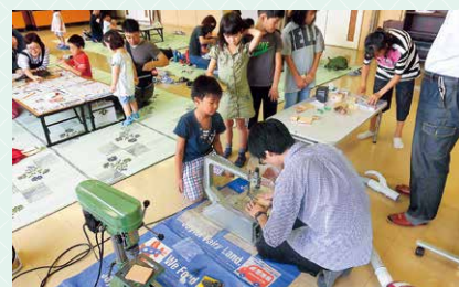
オリジナルバードコール (鳥笛の一種)を作りました。