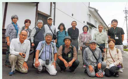
須坂動物園、須坂市内の蔵の街並みを ウォーキングしながら撮影しました。