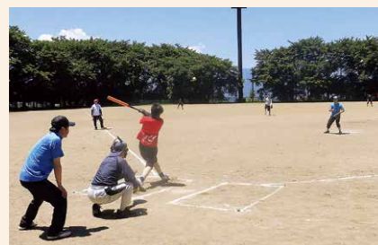
各種目で熱戦が繰り広げられ、 2丁目町会が総合優勝しました。