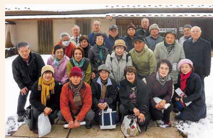
信州高山一茶ゆかりの里へ視察研修に行き、一茶の 句や生涯を勉強して人権感覚を磨きました。