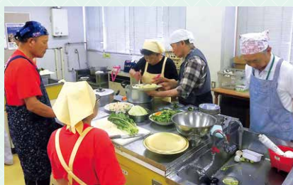
食生活改善推進協議会さんを講師に 美味しい料理を教わりました。