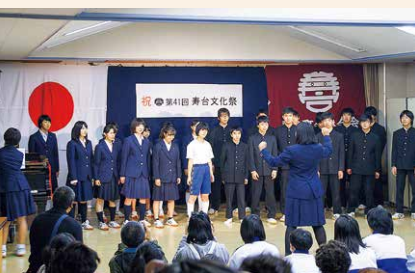
今年も明善中学校3年2組の生徒さんによる合唱、 生徒有志の皆さんによるダンスで盛り上がりました。