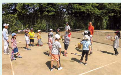
寿台テニスクラブの方々から 熱心に指導していただきました。