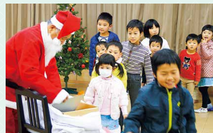
寿台児童館の子どもたちによる創作絵本、紙芝居の読み 聞かせ、サンタさんからのプレゼントがありました。