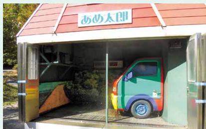
駒ヶ根高原砂防フィールドミュージアムにて 土砂災害について学習し、降雨体験車にも乗りました。