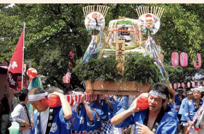
伝統ある夏の風物詩。今年も盛大に開催され、 水神輿が各町会を練り歩きました。