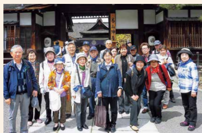
高山陣屋へ歴史学習と 古都散策へ行きました。