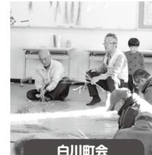
白川町会 しめ縄講習会 日時 平成29年12月23日(土) 場所 白川公民館