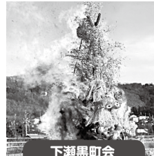
下瀬黒町会 三九郎 日時 平成30年1月7日(日) 場所 松岡病院空き地