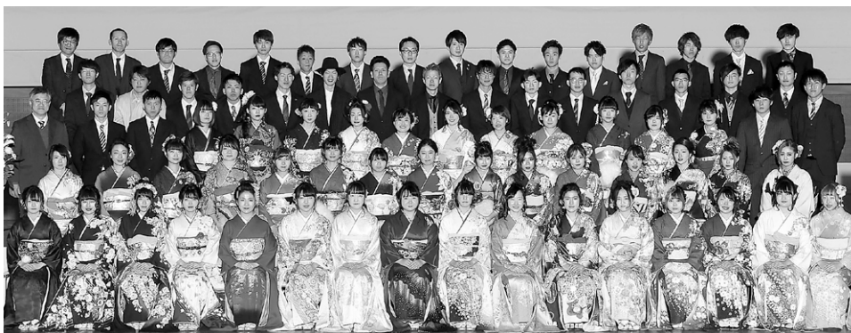
菅野中卒業生の記念撮影