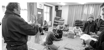
南荒井しめ縄づくり