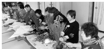
毎年恒例の川東フラワーアレンジメント