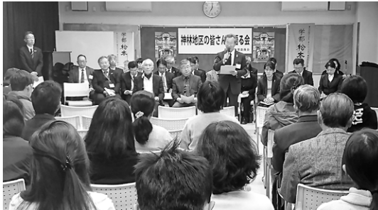
この後、5つのグループに分かれて子ども達のスマホなどの情報ツールの利用や学校教育での疑問、課題について討議しました。参加者からは▽親と子どもとのコミュニケーションが大事だと感じた▽年代の違う皆さんの話が聞けて良かった▽親自身もインターネットについて勉強しなくてはいけない▽子どもの体力低下が著しくなっていて、体育時間の充実を望みたいといった教育行政全般への意見、提言もあり深みのある会になりました。

全体会議では地元の菅野中学校の先生からスマホなどの利用状況について「中学2年からは半数以上が自分専用のものを持っていてインターネットによる動画、ゲーム等の利用により平日は1〜2時間、休日は1〜3時間の使用があり勉強や睡眠時間が減り生活リズムの崩れが心配される」と報告がありました。また、ネット依存やネット被害、SNSト