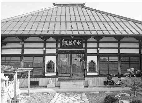
場所 神林梶海渡 松本33番札所第15番札所

開山は丹嶺珉瑞大和尚、御本尊は聖観音である。開山堂には曹洞宗の開祖、道元和尚大禅師、丹嶺珉瑞大和尚の彩色木像が安置されている。現在の水月院は、明治22年に三河の東加茂郡松平村(愛知県豊田市松平町)より移転された。