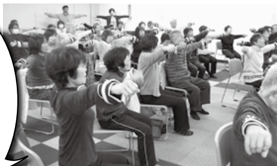
「いきいき100歳体操」の第1回の様子です。