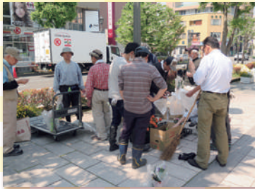
伊勢町1丁目町会 5月22日 「春の育樹祭」