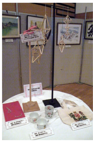
◎生きがい講座受講生作品◎