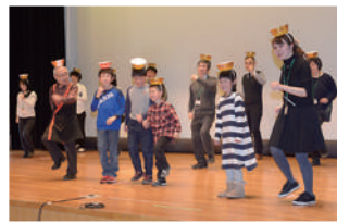
◎有志(ラーメン体操)◎