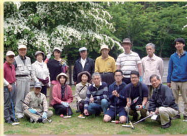
本町5丁目町会 6月18日 「町内マレットゴルフ」