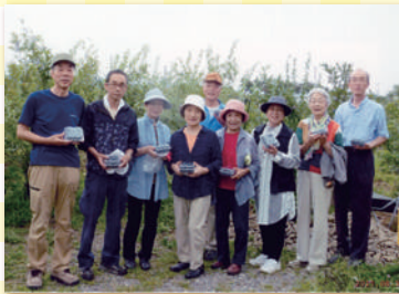
中町2丁目町会 8月30日 「ブルーベリー摘み取り体験」