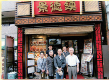
伊勢町3丁目町会 6月18日 「横浜の旅」