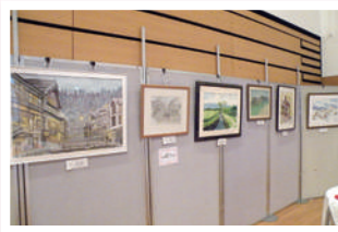
◎楽がき絵画サークル◎