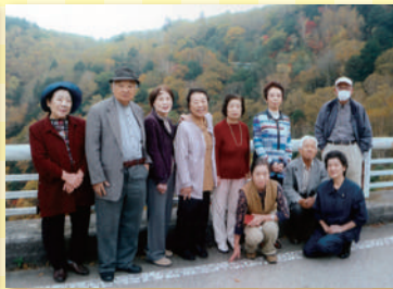
国府町町会 10月12日 「美ヶ原 (ビーナスライン)」