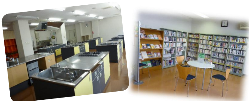
料理実習室と図書コーナー