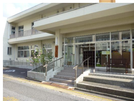
トライあい・松本 正面入口