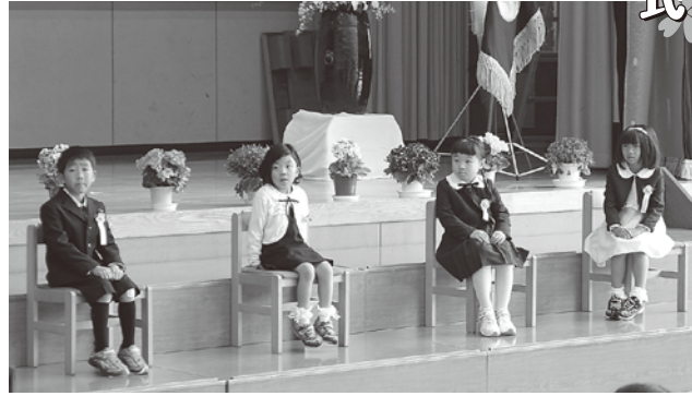
▶ お行儀よくお話を聴く小学 1 年生!

私たち 3 年生は、4 月 10 日～12 日に安曇中と合同で、奈良・京都へ修学旅行に行ってきました。