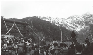
穂高連峰をバックに祭事をカメラに収めようとする参加者たち。

好天に恵まれた河童橋のたもとには観光客をはじめ、地元関係者ら約3,600人が集い、山の安全と盛況を祈願しました。