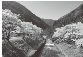
▲車で走行中に目について見に来てくれる人もたくさんいます。今年は特に外国の方が多かったです。