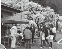
名物になるかも? 大好評だったのしし汁です。

水道管が凍ってしまいう位、厳しい寒さの日が何日もありましたが、芽は少しづつ大きくなり、つぼみは色づき、春先なのに初夏を思わせるような気候が続いたりして、どの地域でも桜の開花が早まりました。町会主催で、住民が気軽に集まり楽しんでもらいたいと、10年ほど前に始まった桜まつりは、開催日と開花の予測が難しいことや、費用のかかる花火大会等を充実させる目的で数年前から開催されませんでした。皆が集い触れ合える場を提供したいと大急ぎで企画が進み、5年ぶりに開催されました。