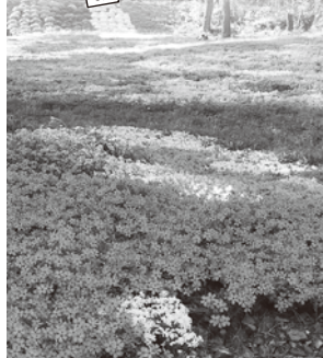
▶5色植えた芝桜は、今では10色以上になりました。