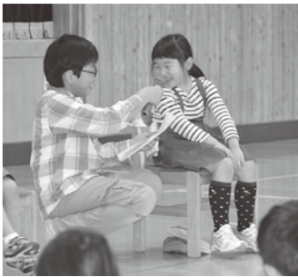
▲ 1 年生に優しくインタビューする 6 年生。

小学校では『1年生を迎える会』、中学校では『生徒総会』が行われ、新年度役員が力を発揮しそれぞれ小・中学校をリードしてくれています。