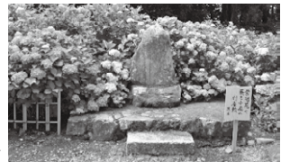
芭蕉句碑 はでさず、 増やすこと しているた め、株数を 寺の家族が 中心になっ て手入れを しているた め、株数を 増やすこと はできず、

隔で植えてあるのか、どのよ うに管理しているのか、といっ たことを見学してきました。矢 田寺には60種類、10,000株ものアジサイが植えられて いて、時期には何万人もの参 拝者が見学に訪れます。 現在当山には、90種類、1、 000株のアジサイが植えら れています。 寺の家族が 中心になっ て手入れを しているた め、株数を 増やすこと はできず、 古くなった株を新しい種類に 少ずつ入れ替えて種類を増 やしています。6月下旬から 7月上旬にかけて花の見ごろ となりますが、例年県内各地 から大勢の方々にお参りいた だいております。種類によっ て咲く時期がずれるので、二 度三度と繰り返し来られる方 も多く、見頃が長いのが特徴 です。 お寺はお葬式をするための場 所ではありません。お参りに来 て下さった方々が、アジサイの 花をご覧になりながら、心にゆ とりと安らぎを持っていただけ たらと願っております。