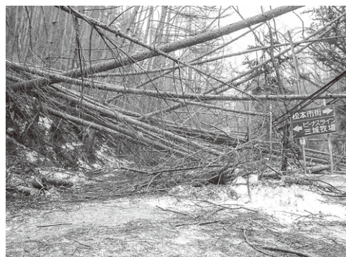
▶平成28年1月の被害の様子