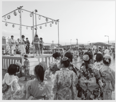
うになったところ、終了となりました。 (館報編集委員 野本)