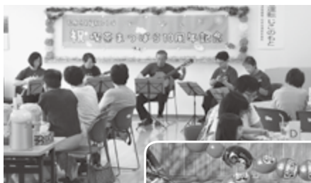
喫茶まつばら 10 周年イベント