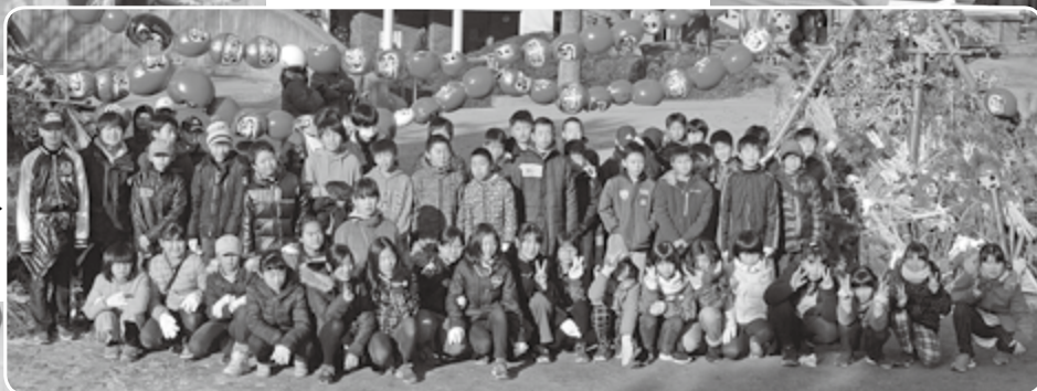
赤沢美林ウォーキング