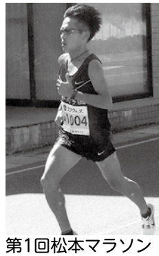
第1回松本マラソン