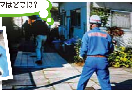
平成22年 開明小学校付近にクマ出没!