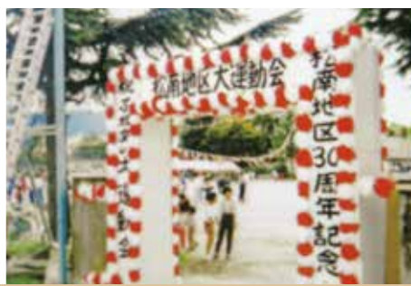
平成3年 松南地区30周年 ふれあい大運動会 こんな事業もありました