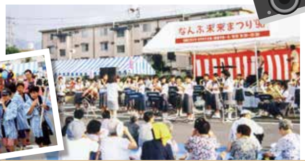
平成5年 なんぶ未来(ゆめ)まつり 開始 おみこしは現在も続いています。