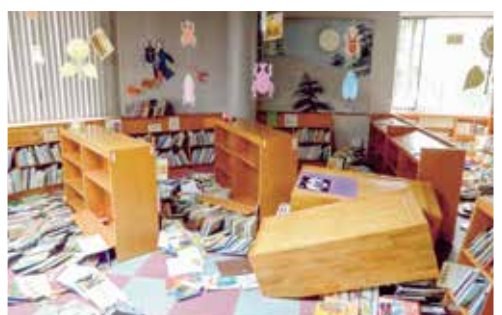
平成23年6月30日 地震発生 私たちには大きな災害でした。