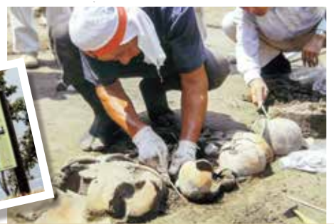
平成25年 大型家具店建設予定地での発掘作業 史跡マップも完成しました。