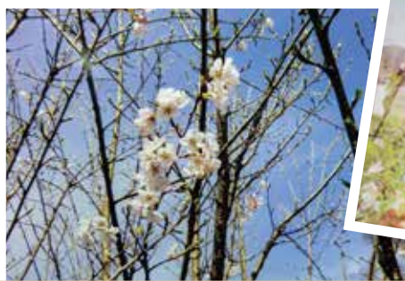
平成24年 芳野町に神代桜を植樹。 いまでは桜の花も咲いています。