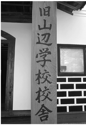
新しい看板に掛け替えました

耐震改修工事等を終えた「旧山辺学校校舎」とプラネタリウムが4月27日(土)にオープンとなりました。