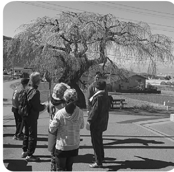
満開の桜が参加者を出迎えました

私達の住む里山辺はとても広く、普段行くことのない所へも行くことができました。立派に咲き誇る大きな桜の木、昔からこの里山辺の地に建つ大きな家など「里山辺にこんな所があったんだ」とたくさんのお発見をすることができました。約二時間半も歩きましたが、あつというまででした。お昼の豚汁がとてもおい