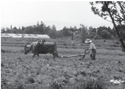
▲牛馬耕、最後の頃の写真