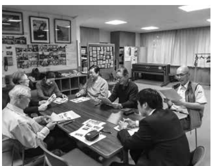
館報編集委員の皆さん