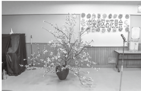
立派な桜が展示されました。