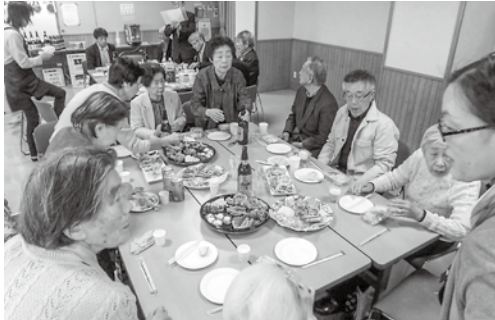
話にも花が咲きました。