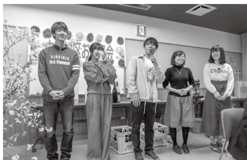
アカペラサークル「CAPEL」の皆さん