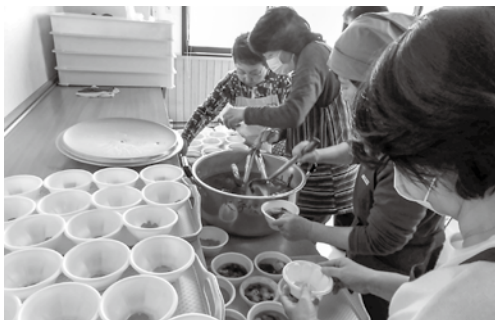
お手製のスープの振る舞いも♪