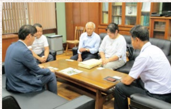
松商学園にお届けしている様子

第三地区まちづくり協議会では、これから学校と連携を取りながら、子どもたちの地域学習に取り組んでまいります。