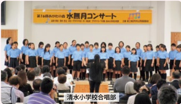
清水小学校合唱部