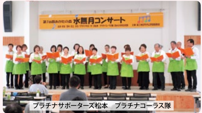
プラチナサポーターズ松本 プラチナコーラス隊