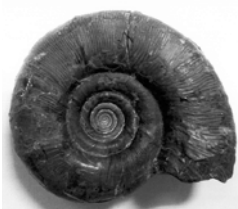
アンモナイトの化石