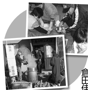
こんにやく作りの様子