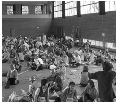
避難所開設時の様子

9月1日、里山辺体育館を会場に大地震を想定した避難所開設訓練を、里山辺自主防災連合会と連携し行いました。今回は里山辺地区指定避難所3か所、山辺小学校、山辺中学校、里山辺体育館の各避難所運営委員会がそれぞれの運営を行い、防犯協会、防災部の町会内パトロールも行われ、山辺中学一年生36名の消火栓取扱講習、負傷者搬送講習会を行い、放水体験等真剣に取り組みました。参加者320名、日赤奉仕団の炊き