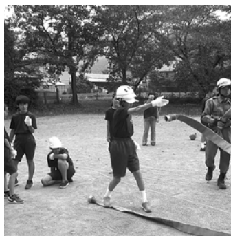
ホースを延ばす様子

その中で一番印象に残っているのは、タンカを作った事です。身の回りにある毛布などで作りました。それだけではなく、一人だった時にどう救助するかも教わりました。