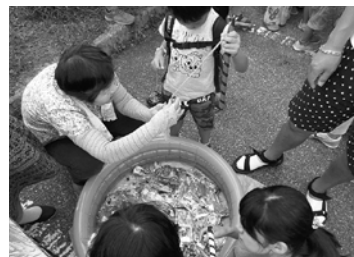
何がつれるかな?おもちゃ釣り

他にも毎年恒例のミニS Lの運行や花火大会などもあったり、金曜日の夜に開催されている