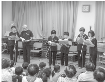
「ちいばっば」さんによる朗読

募集した「平和を伝える三行詩」の作品発表やお話の会「ちいばっば」の皆さんによる朗読やオカリナ演奏がありました。また、昼食は「麦飯」を食べ、戦時中の食事体験をしました。