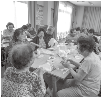
戦時中の食事体験