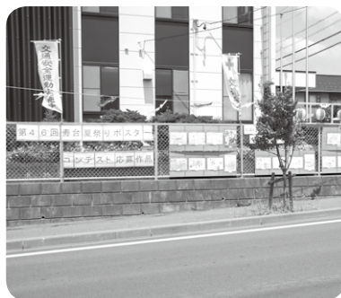
▲ポスターコンテスト

ます。今年、初めての祭典委 員長として、何も分からない 所から始め、寿台町会連合会 役員・スタッフと各町会役員・ スタッフ等の協力で無事寿台