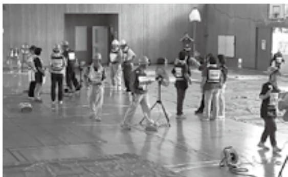
居住スペースの設営

実際の災害発生時にスムーズに避難所を開設し、円滑に運営していくため、今回の避難所開設訓練で浮彫りになった課題を整理し、今後の防災活動に繋げていくことが望まれます。