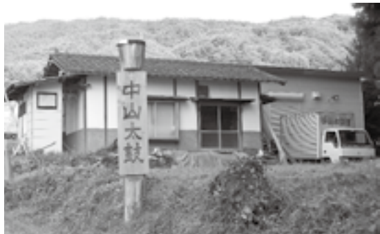
中山太鼓連稽古場