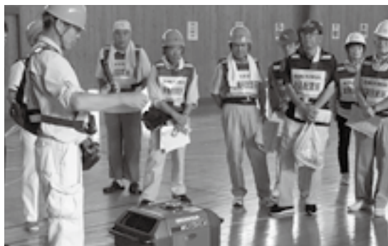
発電機の説明を受ける参加者