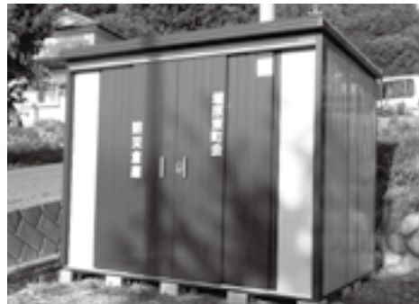
埴原東町会防災倉庫