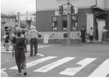
登校時の見守り活動の様子です

☆朝のゴミ出し、植木の水くれ等を見守りの通学時間に合わせて「おはよう」「さようなら」の声掛け。 ☆散歩の途中で危険と思う箇所