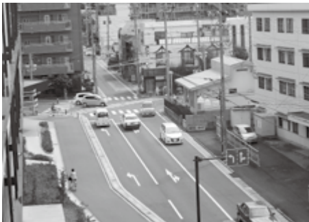
交番の移転により、交差点まで延長予定です

東部交番が、九月十二日から、元八十二銀行清水出張所跡地に移転したのに伴い、いずればイオンモール松本風庭北側の歩道がスクランブル交差点まで延長します。ここは高校生の自転車も多く危険だったため、これで歩行者の安全が確保できると思います。