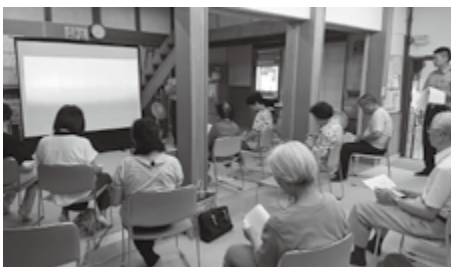
埋橋公民館で行われた様子です