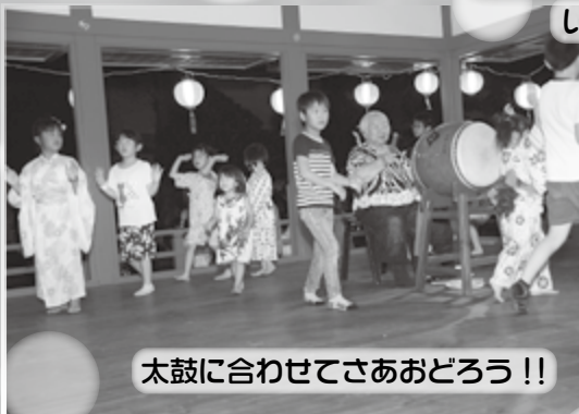
太鼓に合わせてさあおどろう!!