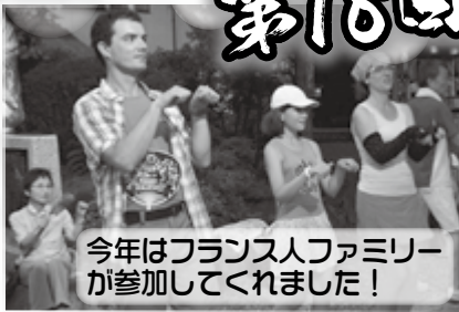
今年はフランス人ファミリーが参加してくれました!

8月12日、第二地区盆踊り大会が深志神社で行われました。400人を超える参加者が踊りにスイカ割り。綿あめ、かき氷等の出店を巡って真夏の夜を楽しみました。