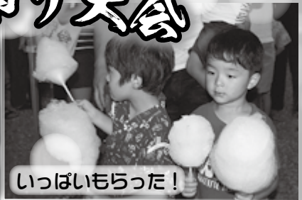
いっぱいもらった!

8月12日、第二地区盆踊り大会が深志神社で行われました。400人を超える参加者が踊りにスイカ割り。綿あめ、かき氷等の出店を巡って真夏の夜を楽しみました。