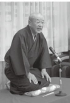
すずの家真田丸さん