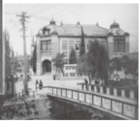
当時の松本市役所