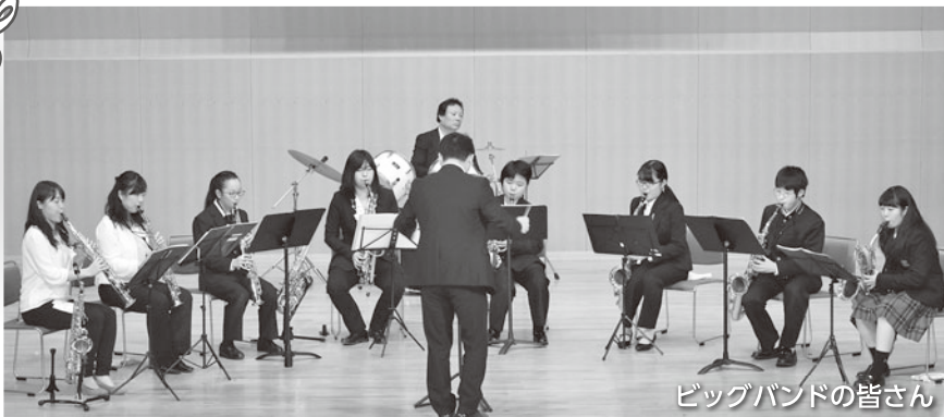
ビッグバンドの皆さん