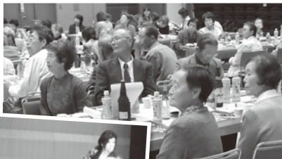
▲和やかな祝宴会場

参加者の一人は、「楽しい時間を過ごすことができました。健康に過ごして来年も祝賀会に参加したいです」と笑顔で話していました。