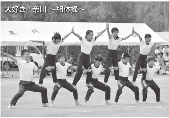
大好き! 奈川 ~組体操~