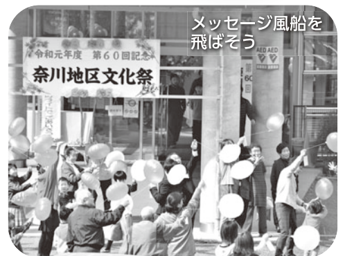
メッセージ風船を飛ばそう