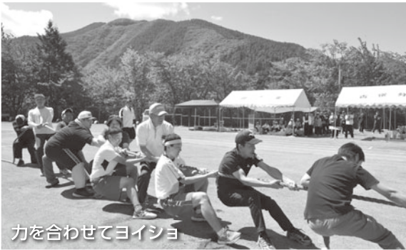
力を合わせてヨイショ