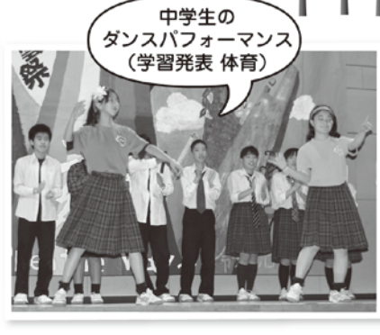
中学生の ダンスパフォーマンス (学習発表 体育)