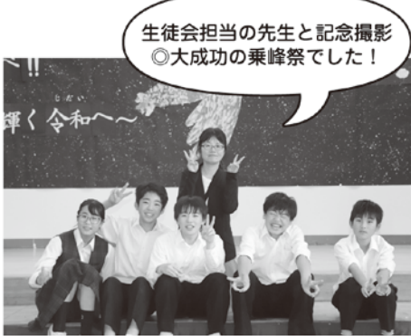
生徒会担当の先生と記念撮影 ◎大成功の乗峰祭でした！

今年の乗峰祭は新しい時代「令和」の始まりで乗峰祭が五十回目という節目の年でした。昨年は一年生だったのが、先輩の姿を見て、ついでにいけばよかったのが、今年是一年生が加わり、僕達二年生は教える側になったので、更に大変でした。今年も準備が忙しかったのですが、小学生や地域・保護者の方々に楽しんでもらえたと思います。