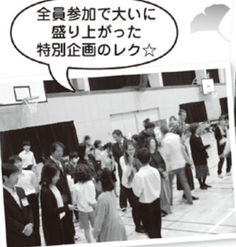
全員参加で大いに 盛り上がった 特別企画のレク☆

皆に将来の夢を持ってもらったので良かったです。来年は小学六年生が新一年生として一緒に活動するので、今年と同じくらい最高の乗峰祭にしたいです。