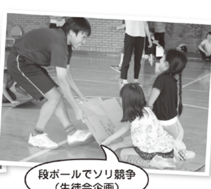
段ボールでソリ競争 (生徒会企画)