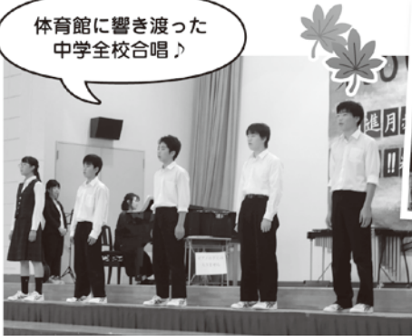
体育館に響き渡った 中学全校合唱♪

今年の乗峰祭は新しい時代「令和」の始まりで乗峰祭が五十回目という節目の年でした。昨年は一年生だったのが、先輩の姿を見て、ついでにいけばよかったのが、今年是一年生が加わり、僕達二年生は教える側になったので、更に大変でした。今年も準備が忙しかったのですが、小学生や地域・保護者の方々に楽しんでもらえたと思います。