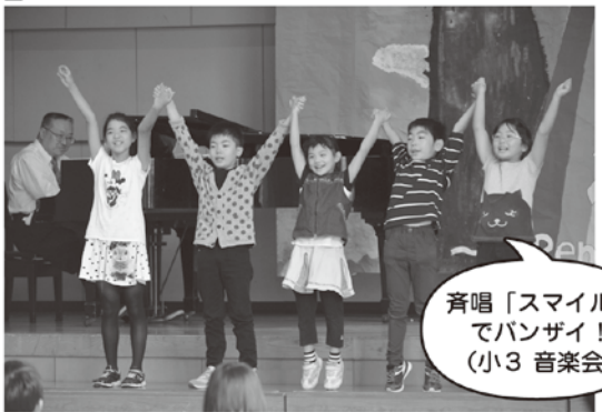
斉唱「スマイル」 でバンザイ！ (小3 音楽会)