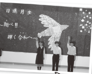
声高らかに閉祭宣言！