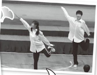
息びったりの ダンス発表◎