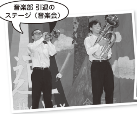
音楽部 引退の ステージ (音楽会)