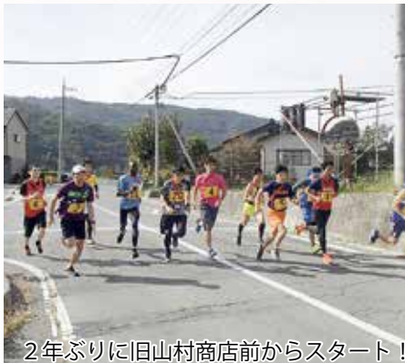
2年ぶりに旧山村商店前からスタート!

11月3日正午、2年ぶりに旧山村商店前をスタート地点に10チーム十中央地区体育協会チームの参加で60回記念の四賀一周駅伝が開催されました。10月12日の台風19号豪雨の爪痕も残る中、熱戦が繰り広げられました。 復旧が進む2年前の落水の県道崩落現場が特別に走れることになり、本来のコースでの開催となりました。優勝は2年連続の赤怒田でした。 競技終了後記念式典があり、昭和34年の台風災害を機に始まった大会60年の歴史が、当時の関係者の話とともに振り返られました。また、優勝旗、入賞盾も新調されました。