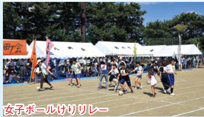
女子ボールけりリレー