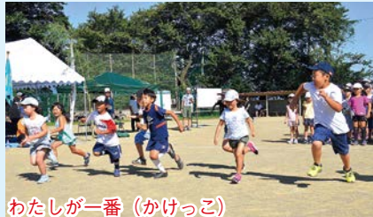
わたしが一番(かけっこ)