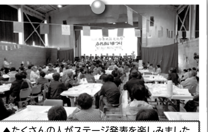
▲たくさんの方がステージ発表を楽しみました