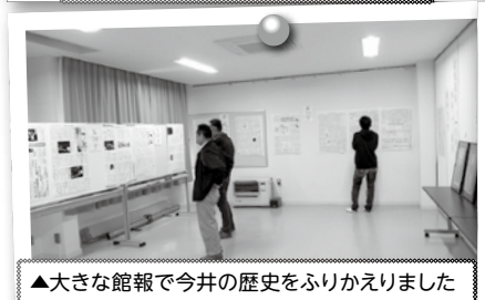
▲大きな館報で今井の歴史をふりかえりました