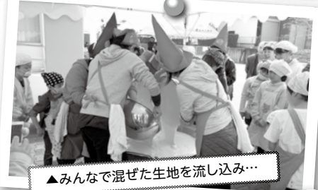
▲みんなで混ぜた生地を流し込み...