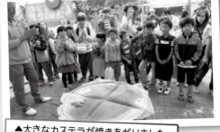
▲大きなカステラが焼きあがりました