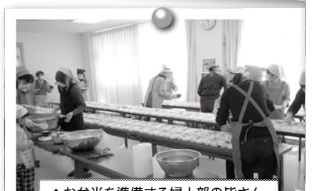
▲お弁当を準備する婦人部の皆さん