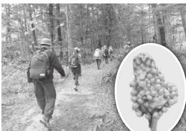
天南星を目指して

10月26日(土) 5月にタケノコの芽吹き、の岳都講座で、閉山まであと20日余りとなった残秋の上高地で、5月にタケノコの芽吹き、の様だった天南星の成長を確かめる為散策を行いました。赤い実はいよいよ落ちていきましたが観ることが出来ました。