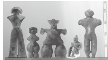
⇐ 40cm 土偶の高さ比較