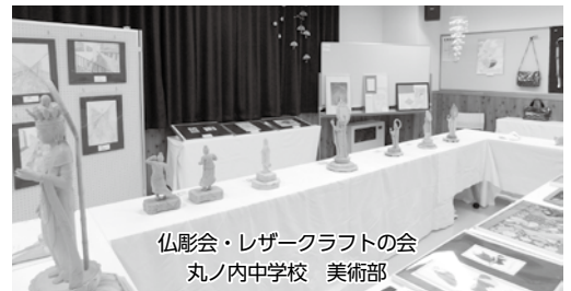
仏影会・レザークラフトの会 丸ノ内中学校 美術部