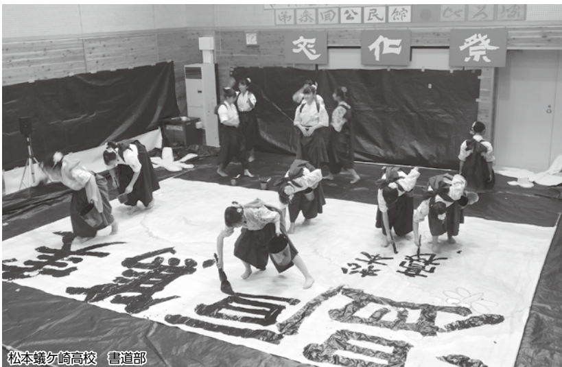
松本蟻ヶ崎高校 書道部