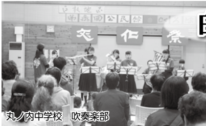
丸ノ内中学校 吹奏楽部