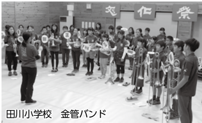
田川小学校 金管バンド