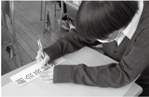
生徒会選挙に向けた準備の様子

私たち三年生もちょうど一年前のこの時期に選挙を行い生徒会を引き継ぎました。生徒会役員を中心に、学年全体で活動を始めました。最初は分からないことが多く、うまく活動が進められませんでした。しかし、選挙の時と同じように、一人ひとりが全力で取り組み少しずつ成長することができました。そして、学芸発表会などの行事を成功させたり、日常の中の活動をしつかり進めたりできるようになりました。それができた