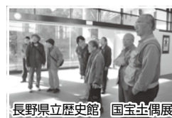
長野県立歴史館 国宝土偶展

10月28日(月) 長野県立歴史館で開催中の「国宝土偶」展を見学しました。長野県は、国宝土偶が2点、2000点を超える土偶が出土している全国でも有数の土偶製作地域だということを知ることが出来ました。国宝土偶の地域的な違い、大きさ、個性、等が分かり、縄文文化に魅せられた土偶展でした。