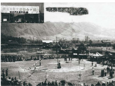
《南松本町大運動会》 (設立第三回記念、昭和24・10・16)

地区には以前「史跡ゾーン整備研究委員会」が、弘法山古墳の後背地となる集落跡が松南地区で確認されたことを冊子で報