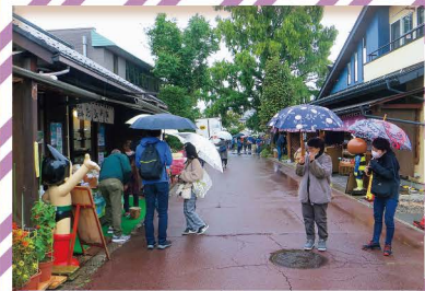
小布施ウォーキング 久々の小旅行。雨の小布施を満喫！