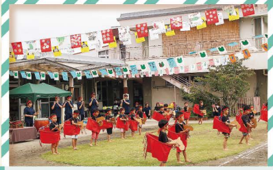
宮田保育園 年長さんのお楽しみ。上手な「馬っこ」だよ。