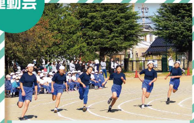
開明小学校 コロナに負けない姿勢を示した6年生！