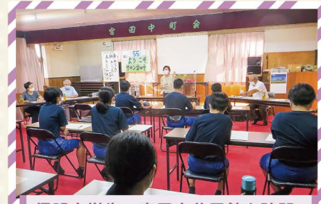
信明中学生、宮田中公民館を訪問 「地域は皆の力で生きる場よ」と、教わりました。