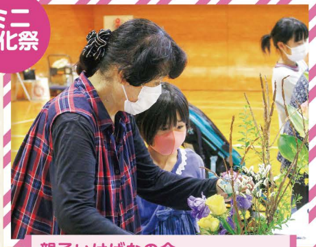
親子いけばなの会 ここを直すといいわよ…。