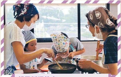
親子料理教室 カレールーは、香りで決めるのよ！