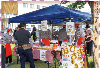
ポリジ・マルシェ ポリジと仲間たちの青空市場。