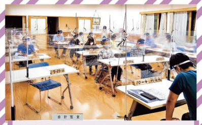
芳野町会総会 「密」を避けて、「パーティション総会」！