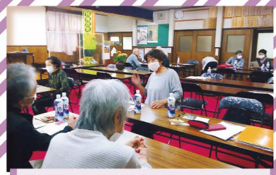
「サロン宮田中」 「密」を避け、二回に分けて実施。マスクでも楽しいおしゃべり…。