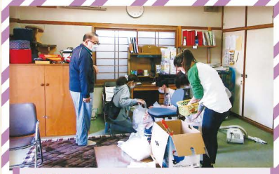
双葉南町会公民館リフォーム どんな公民館になるのかな？楽しみ、ワクワク…。