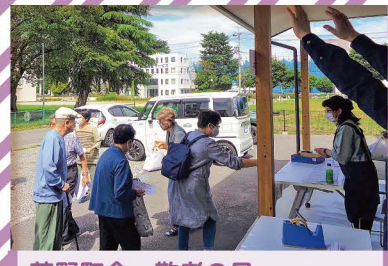
芳野町会 敬老の日 「長寿の会」も並んで記念品をテイクアウト。ごめんなさい。