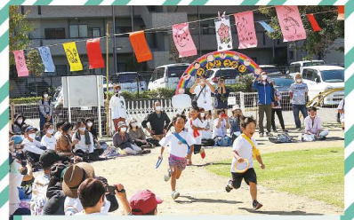
南松本保育園 応援に応えて、猛ダッシュ！