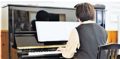
【クシコスポスト】鳴り響く！

そこで町会役員に相談。高価な物ゆえ、経費は容赦ありません。経費捻出を承諾していただきま