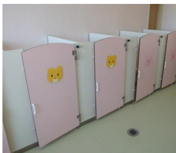
← ↓ 以上用トイレ