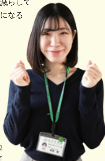
環境・地域エネルギー課 杵淵主事