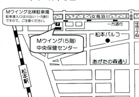
中央保健センター