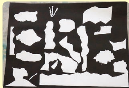
▲「どうぶつたちのコースぱしり」 もり ひな