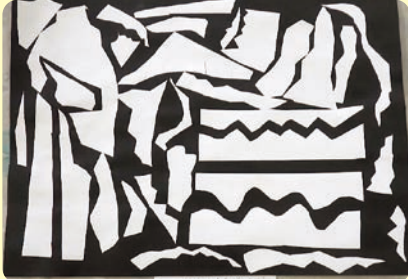
▲「くねくねみちのだいぼうけん」 おおしろ かえで