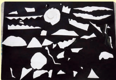
▲「こわーいこわーい おばけのたにおもしろいぞ!!」 あおきはなり