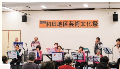
夢ハーモニーつどい