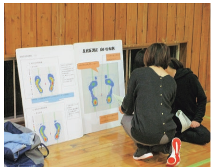
結果を丁寧に説明していただきました

た。1時間30分なんてあっという間で久しぶりにいい汗を流しました。毎年開催しているとの事ですので、日頃運動不足を感じているあなた、ぜひ参加してくださいね。