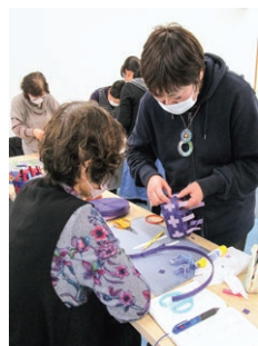
カゴの編み方を教わる