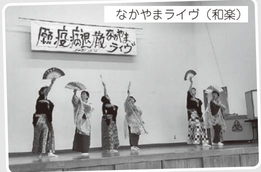
なかがやまライヴ (和楽)