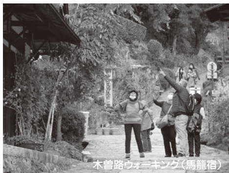
木曾路ウォーキング(馬籠宿)

11月30日(火)に、公民館事業「秋の木曾路ウォーキング」が開催されました。11月末は暦の上では、「初冬」や「初雪」の時期ですが、当日は天気にも恵まれ、絶好のウォーキング日和となりました。 山間部にいくつもの宿場町があり、古くから交通の