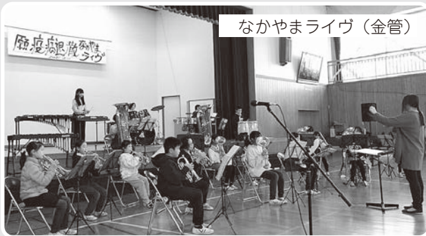
なかがやまライヴ (金管)