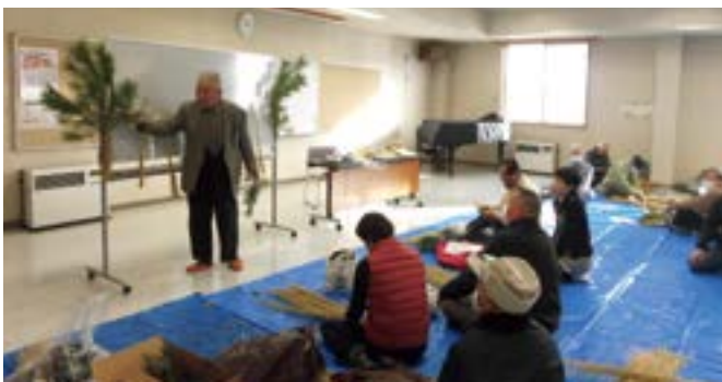
▲しめ縄作り講習会(12月18日)