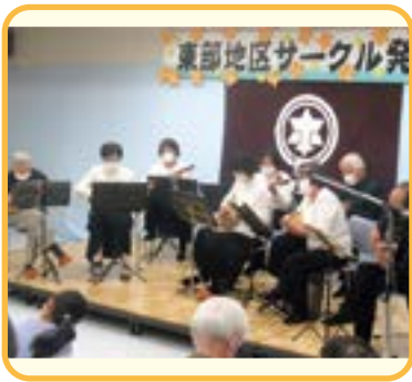
▲東部クラシコマンドリーノ