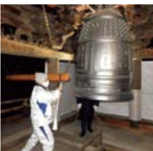
▲県宝旧念来寺鐘樓の除夜の鐘つき(12月31日)

県宝旧念来寺鐘樓の 除夜の鐘つき 妙勝寺境内にある県宝旧念来寺鐘樓で除夜の鐘つきが行われました。近隣住民が集まり、気持ち良く新年を迎えるため、清らかな鐘の音を響かせました。