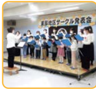
▲清水小PTA親子コーラス