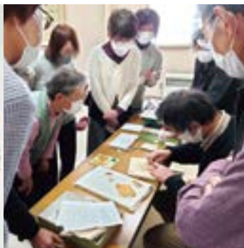
▲干支押絵鑑講習会(11月25日)