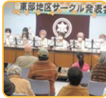
▲ミュージックベル