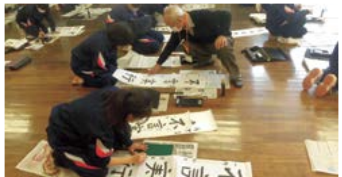
▲清水中学校書道教室(12月10日、13日~15日)