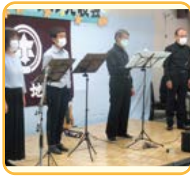
▲ポットアップー・スピカ