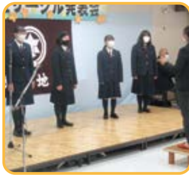
▲清水中学校合唱部