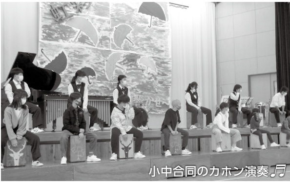
小中合同のカホン演奏