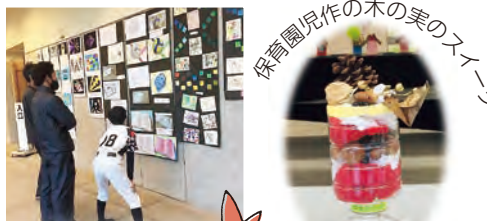
保育園児作の木の美のスイーツ