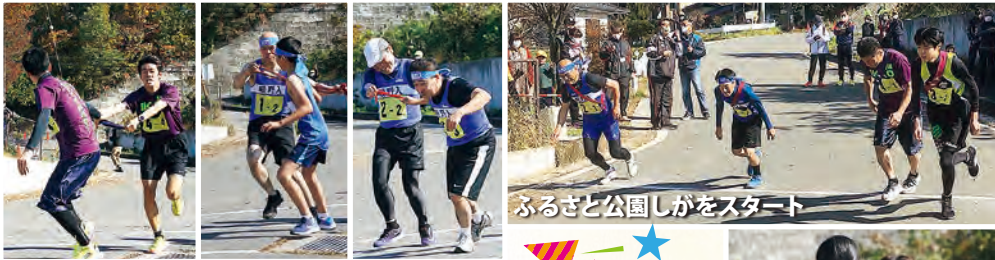
ふるさと公園しがをスタート

四賀の世帯数・人口 世帯数 1,906 世帯 人口 4,182 人 男 2,020 人 女 2,162 人 (令和3年11月1日現在)