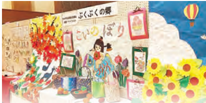
デイサービスの皆さんが協力して作った大作