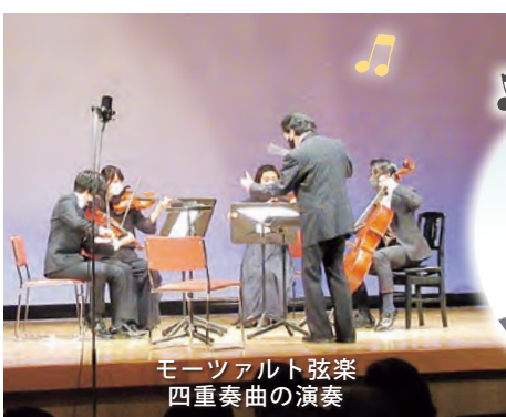
モーツァルト弦楽四重奏曲の演奏

全国各地から訪れた約230人の方が未病改善・健康増進に向け、真の音楽セラピーを肌で感じました。