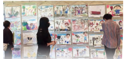
地区の小中学生の絵や習字 どれも力作