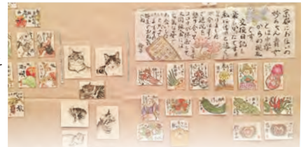
絵手紙がたくさん どれも思いがこもっている