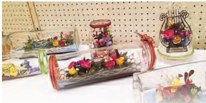
生の花から作るフラワーボトルは色鮮やか