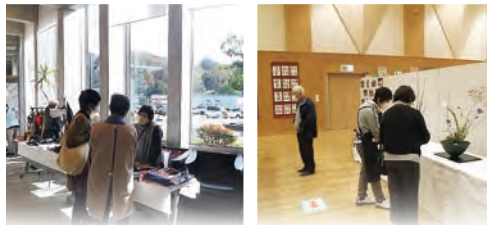
多種多様な作品が出展され見て回るのが楽しい