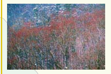
【化粧柳】 氷河期の生きた化石。幹や枝が白く化粧したように見えたり、冬季に枝先が紅色に染まることが由来。日本では、北海道の一部と本州の上高地及び梓川流域の一部に分布。