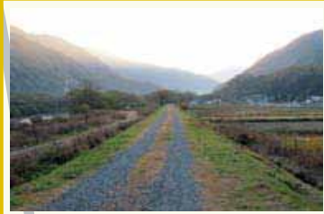
【歩道】 西に乗鞍・上高地、東に美ヶ原の眺望が美しい。