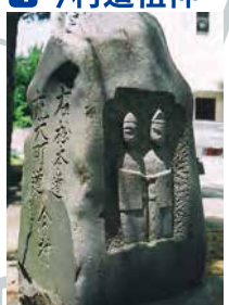
笹賀地区の道祖神のうちで最も古い紀名。