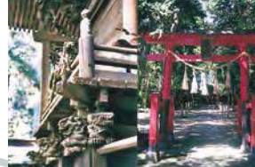
本殿の彫刻は市重文に指定。