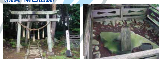
7世紀の古墳、そこに柏木社が祀られている。