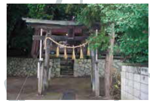
段丘の中腹に本殿、下段に拝殿。祭神は建御名方命。