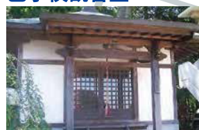
市重文の「木造千手観音立像」が鎮座。信州筑摩33ヶ所観音霊場の32番札所。