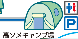
高ソメキャンプ場