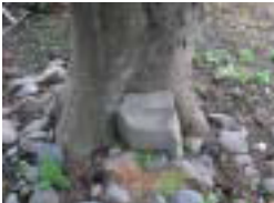
9 根石の石 根石の地名の由来となった石