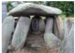
8 穴薬師 お墓の一角に建てられた薬師如来大きな石で守られている