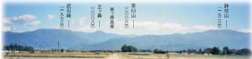
新的里から望む東山