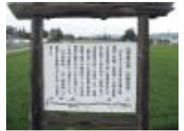
1 旧野麦街道のたて看板 新村に4箇所設置されている