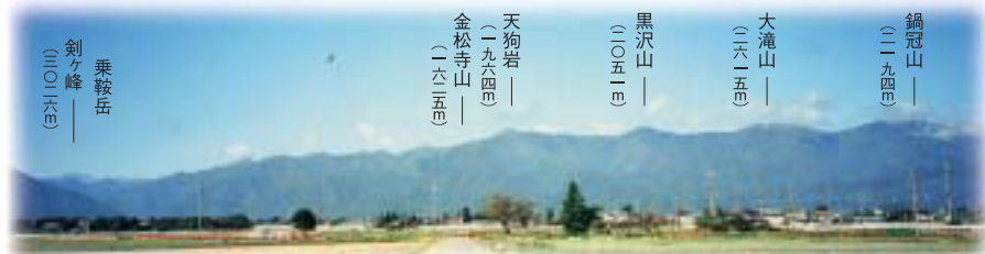
西山方面を旧野麦街道から望む

江戸時代は信州から米・清酒、飛騨からは海産物などが運ばれた重要な街道であった。 また明治から大正にかけては諏訪、岡谷地方の製糸工場へ工女たちが往來した道である。