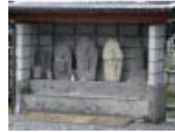
4 浄土宗日光山清浄院跡 創立年号不詳、念蓮社正覚見阿の開山と伝えられている