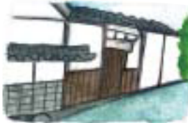
2 黒門 松本城南門から移築されたといわれている