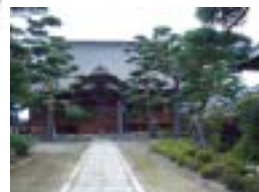
6 専称寺 戦国時代、永禄元年(1558)の創建であり甚蓮社幸譽同上人により開山された