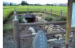
7 安塚古墳 梓川の平な花崗岩を積み上げた横穴式石室古墳