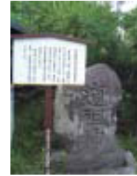
3 松本藩高礼場跡 藩の法度、掟書、御触書等を記し掲示した場所