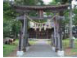
5 岩崎神社 岩崎神社は諏訪大社の御祭神を奉祭し現在の地に仁寿3年(853)鎮座したと伝えられている