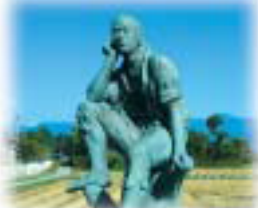
新的里で ものぐさ太郎はお空の向こうを見てばかり伝承地にて