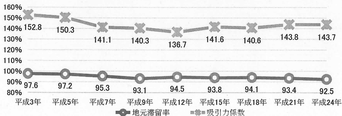
松本市における地元滞留率と吸引力係数

松本市の平成24年度における商圈人口は、525,918人、地元滞留率 1 は92.5%、吸引力係数 2 は143.7%である。