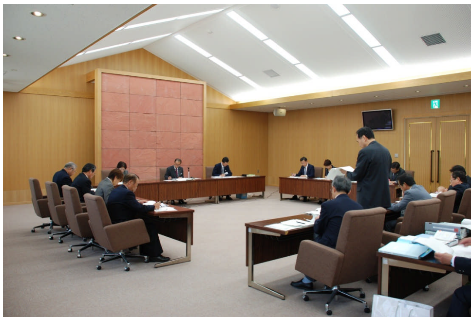
教育民生委員会 小学校統合(平成19年10月)