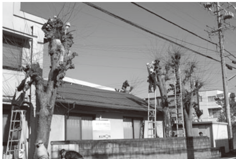
▲公民館のケヤキ枝払い作業

子ども達が雪道でも安全に登校できるように、毎年12〜2月にかけて旭町小学校の通学路の除雪作業を行っています。信州大学忠誠寮の学生さんにもお願いして、手伝っていただくこともあります。