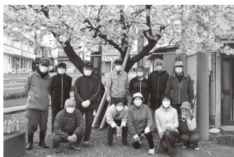
▲元町北ゴミ拾い隊の皆さん