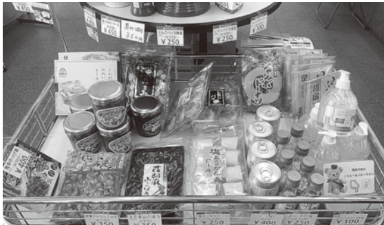
▲松本のみやげもの